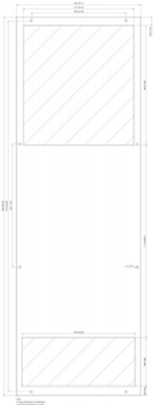
click image to enlarge